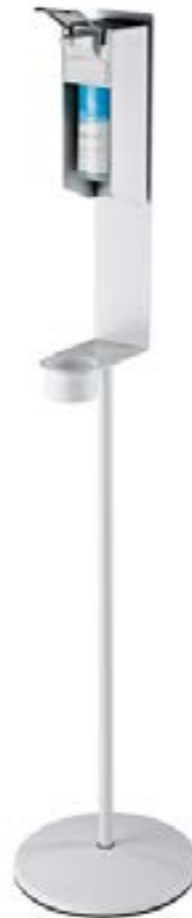
Variante 3 / Mit geschlossener Spenderhalterung für Behältnisse der Größen 350/500 ml und 1.000