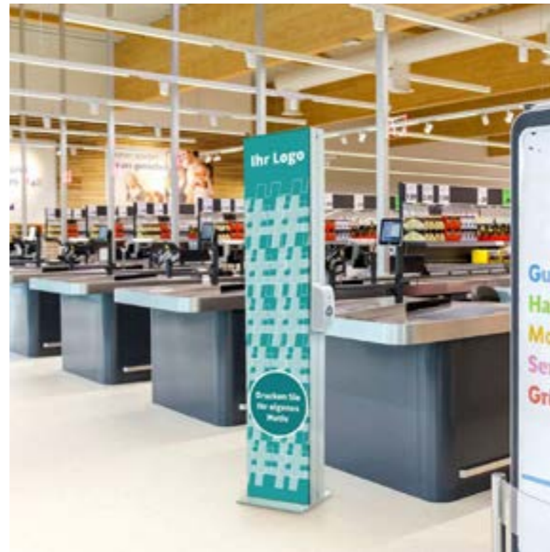
Leucht-Infosteile mit Desinfektionsspender - Variante M