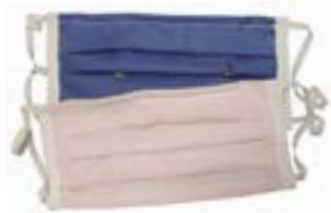
Art.-Nr. S 39949/00KM

Auf Wunsch können die Masken auch individuell gebrandet werden - zum Beispiel mit Ihrem Markenlogo.