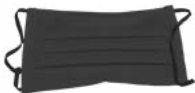
Art.-Nr. S 39949/00AM