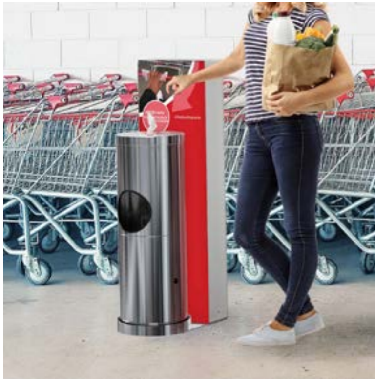
Leucht-Infosteile mit Desinfektionstüchern und Mülleimer

Die frei gestaltbaren Lightboxen vom etablierten Messe-Display-Produzenten PIXLIP ermöglichen eine individuelle Gestaltung hochwertiger Displayanzeigen. Die Kombination mit einem integrierten Desinfektionsmittelspender erlaubt die kontaktlose Handreinigung. Für eine konstante Markenkommunikation bei maximaler Funktionalität.