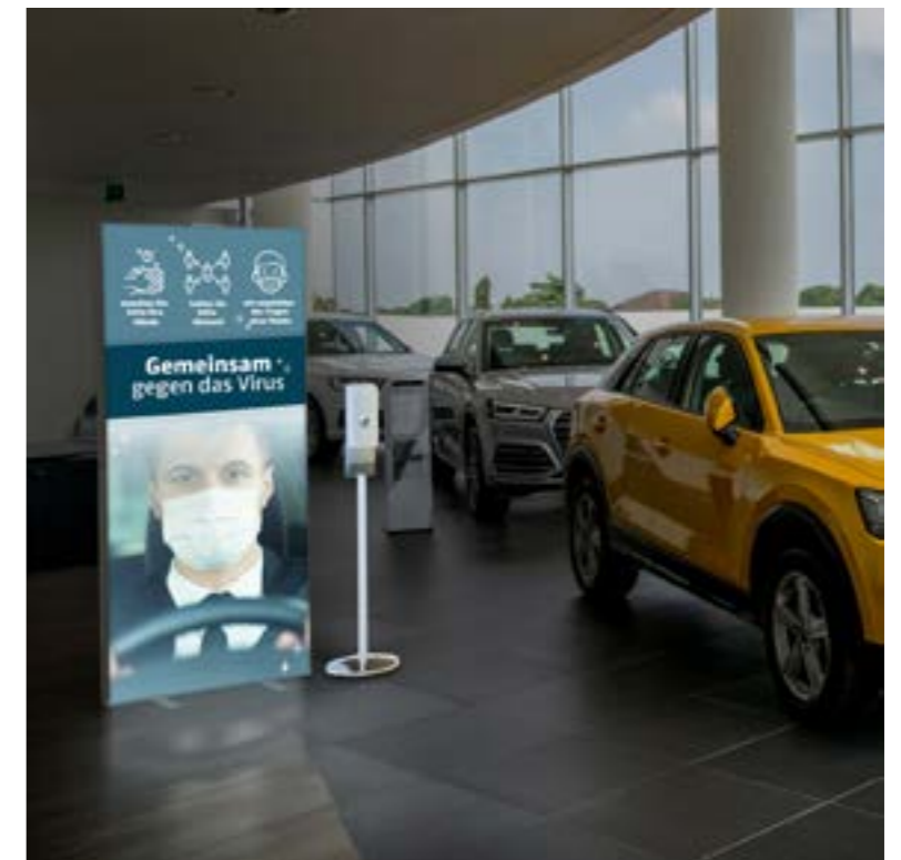
Desinfektionsspender mit Sensor, Standfuß und INFO LIGHTBOX