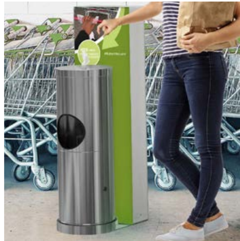
Leucht-Infosteile mit Desinfektionstüchern und Mülleimer