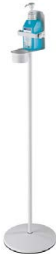
Variante 2 / Mit Klemmbügel zum Fixieren der Desinfektionsflasche