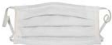
Art.-Nr. S 39949/000M